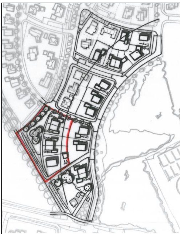
Indicatieve stedenbouwkundige verkavelingstekening

Een nieuw bestemmingplan dient te worden vastgesteld om de beoogde woningen mogelijk te maken. In het kader van de te doorlopen planologische procedure moet worden aangetoond dat de voorgenomen ontwikkeling in lijn is met een 'goede ruimtelijke ordening'. Om de haalbaarheid van deze ontwikkeling aan te tonen dient onder meer getoetst te worden aan de Ladder voor duurzame verstedelijking. In voorliggend document wordt getoetst aan de Ladder voor duurzame verstedelijking in relatie tot de voorgenomen ontwikkeling. Navolgende afbeelding toont het beoogde schetsontwerp van de woningbouwontwikkeling (dikgedrukte percelen excl. de rood omlijnde percelen)