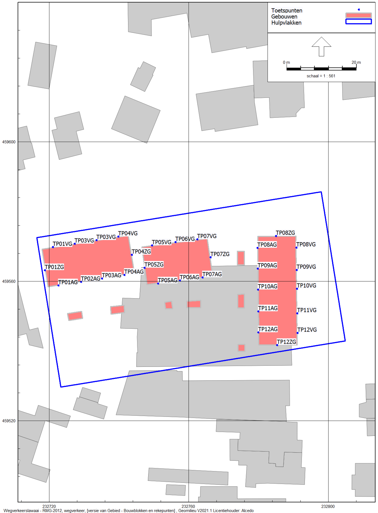
Figuur 1 | Posities van bouwblokken en rekenpunten