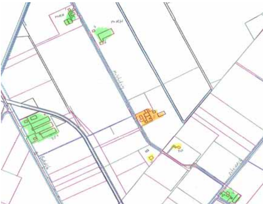
Omgeving Hulshofweg 8. Oranje is aanvrager, geel burgerwoningen, groen veehouderijen.

In de omgeving van de aangevraagde ontwikkeling bevinden zich de onderstaande bedrijven