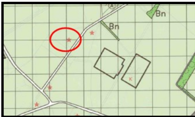
Uittreksel bestemmingsplan Buitengebied Eibergen (niet op schaal). Haaksbergse Binnenweg 1 is omcirkeld.

De op het perceel aanwezige bijgebouwen overschrijden al de maximaal toegestane oppervlakte van 70 m 2 . Ook binnenplanse vrijstellingsmogelijkheden bieden geen mogelijkheden om de gevraagde oppervlakte van 60 m 2 toe te staan.