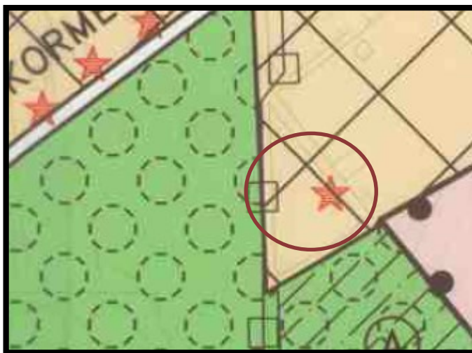
Uittreksel bestemmingsplan Buitengebied Eibergen (niet op schaal). Vaarwerkweg 4 is omcirkeld.

De op het perceel aanwezige bijgebouwen overschrijden al de maximaal toegestane oppervlakte van 70 m 2 . Ook binnenplanse vrijstellingsmogelijkheden bieden geen mogelijkheden om de gevraagde oppervlakte van 84 m 2 toe te staan.