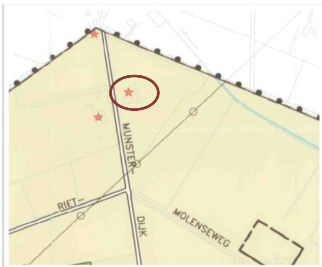
Uittreksel bestemmingsplan Buitengebied Eibergen (niet op schaal). Munsterdijk 4 is omcirkeld.

De op het perceel aanwezige bijgebouwen overschrijden al de maximaal toegestane oppervlakte van 70 m 2 . Ook binnenplanse vrijstellingsmogelijkheden bieden geen mogelijkheden om de gevraagde oppervlakte van 166 m 2 toe te staan