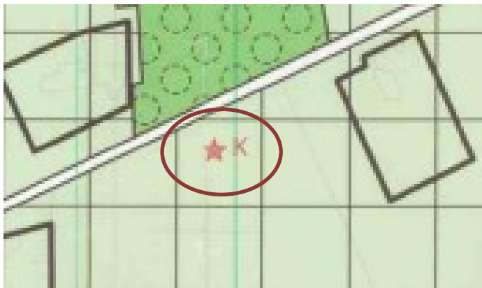
Uittekst bestemmingsplan Buitengebied Eibergen (niet op schaal). Lintveldseweg 5 is omcirkeld.

Lintveldseweg 5 in Eibergen heeft de bestemming "Wonen". Het bestemmingsplan Buitengebied Eibergen staat slechts toe dat de totale oppervlakte aan bijgebouwen maximaal 70 m 2 mag zijn. Omdat met deze aanvraag de totale oppervlakte aan bijgebouwen uitkomt op ongeveer 296 m 2 , kan er op basis van het geldende bestemmingsplan geen medewerking worden verleend.