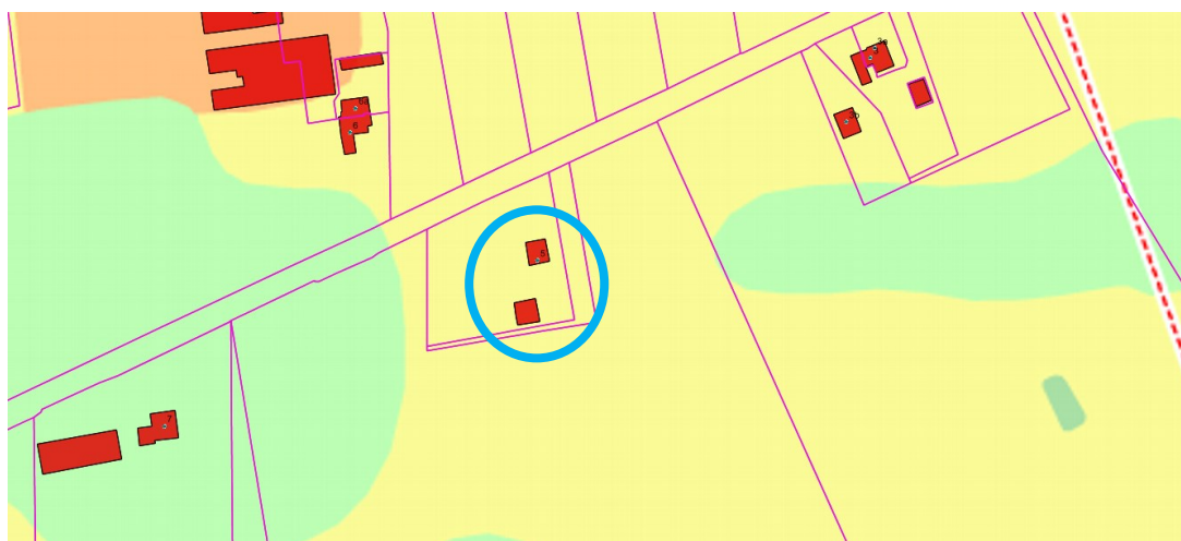
Uitsnede uit geldende archeologische beleidskaart van de gemeente Berkelland

Op de geldende archeologische beleidskaart is te zien dat het bijgebouw gebouwd wordt in een gebied met een archeologisch middelmatige verwachting (de gele kleur op onderstaande kaart). In een gebied met een middelmatige archeologische verwachting is archeologisch onderzoek nodig bij verstoring van de bodem over een oppervlakte van meer dan 1.000 m 2 . Omdat de bodemverstoring voor het bijgebouw maar ongeveer 88 m 2 is, dus ruim onder de 1.000 m 2 blijft, is een archeologisch onderzoek niet noodzakelijk.