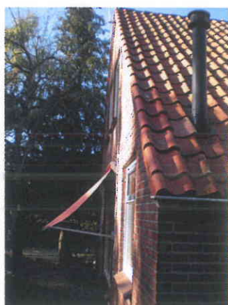
Foto 3 zijaanzicht voorgevel pand