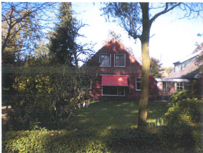
Foto 1 vooraanzicht