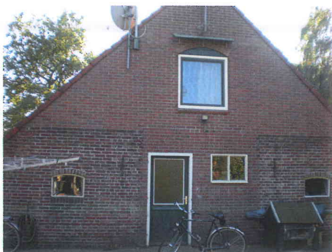
Foto 2 achterzijde pand