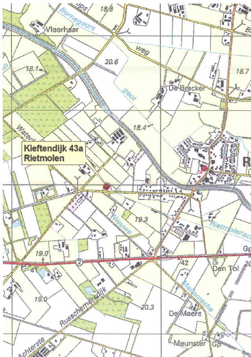
Figuur 1 projectlocatie