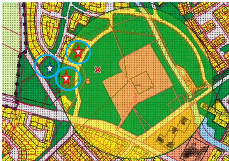
Afb. 1: Situatie van 3 locaties kaveluitgifte plan Het Elbrink in Borculo