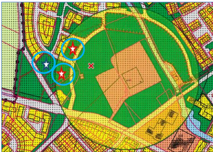
Afb. 1: Situatie van 3 locaties kaveluitgifte plan Het Elbrink in Borculo