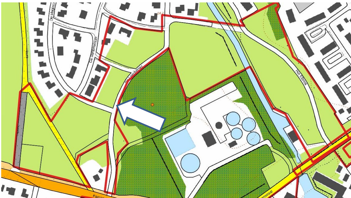
Afbeelding 3: Uitsnede uit topografische kaart met het onderzoeksgebied (rood omrand)

Uit het onderzoek bleek dat het gebied een relatief lage en natte ligging heeft, en daardoor in het verleden minder geschikt was voor bewoning. Ook bleek in een deel van het plangebied de bodem diep verstoord te zijn. Om deze redenen was een vervolgonderzoek niet noodzakelijk.