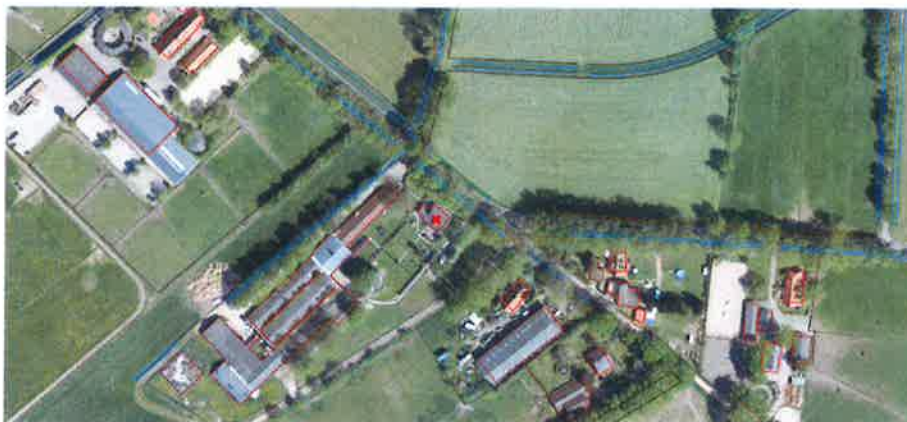
Luchtfoto (mei 2016)

Bij de gemeente Berkelland is het verzoek binnengekomen om het bestemmingsplan te wijzigen voor het perceel Molenweg 14 in Eibergen. Verzocht wordt om de agrarische bestemming te wijzigen in een woonbestemming.