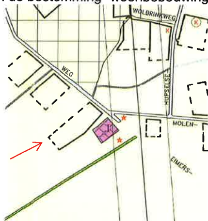
Uittreksel plankaart "Buitengebied" (Eibergen)

Het bestemmingsplan "Buitengebied" (Eibergen) kent aan het perceel Molenweg 14 de bestemming "Agrarisch gebied". Daarbij is het perceel voorzien van een agrarisch bouwvlak waarbinnen bebouwing mag worden gerealiseerd ten behoeve van het agrarisch bedrijf. Deze bestemming laat het voeren van een agrarisch bedrijf toe. Nu de agrarische bedrijvigheid ter plaatse is beëindigd, wordt verzocht om deze bestemming te wijzigen in de bestemming "woonbebouwing".