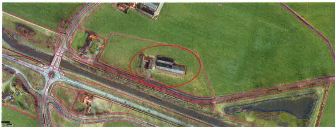
Afbeelding 1: Luchtfoto

Bij de gemeente Berkelland is op 23 februari 2018 het verzoek binnengekomen om het bestemmingsplan te wijzigen voor het perceel Hemminksweg 2 in Beltrum. Verzocht wordt om de agrarische bestemming te wijzigen in een woonbestemming.