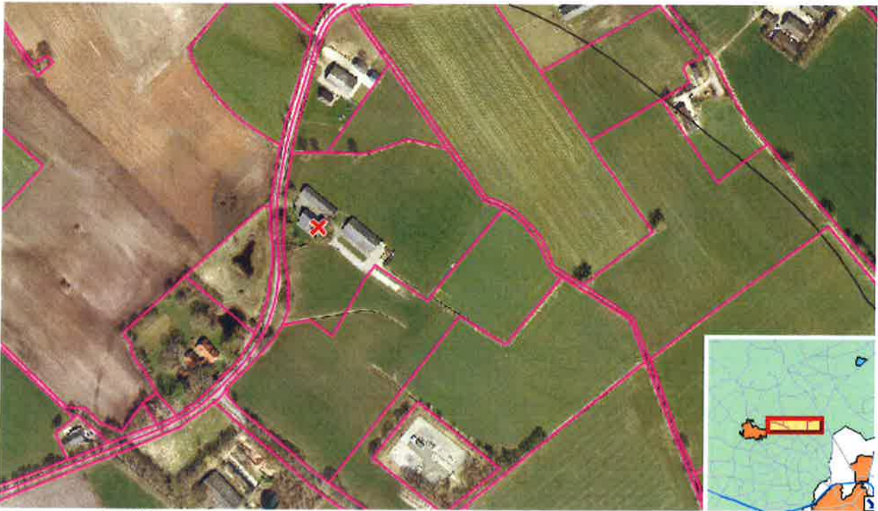
Afbeelding 1: Luchtfoto

Bij de gemeente Berkelland is op 6 september 2018 het verzoek binnengekomen om het bestemmingsplan te wijzigen voor het perceel Spilmansdijk 6 in Beltrum. Verzocht wordt om de agrarische bestemming te wijzigen in een woonbestemming.