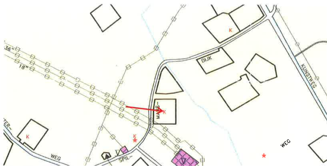
Afbbeelding 2: uitsnede plankaart "Buitengebied" (Eibergen)

Het bestemmingsplan "Buitengebied" (Eibergen) kent de mogelijkheid om de bestemming "Agrarisch" om te zetten in de bestemming "woonbebouwing". Volgens artikel 6, lid 6, onder c van de planvoorschriften is dit toegelaten door toepassing van de wijzigingsbevoegdheid uit het voormalige artikel 11 van de Wet op de Ruimtelijke Ordening (WRO) die tegenwoordig is neergelegd in artikel 3.6, onder 1, sub a van de Wet ruimtelijke ordening (Wro). Het college van burgemeester en wethouders kan deze wijzigingsbevoegdheid toepassen op voorwaarde dat: