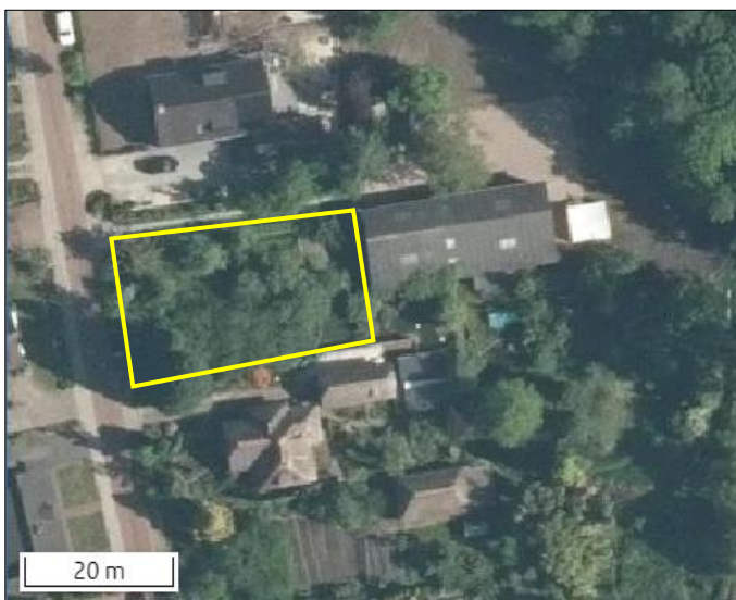
Begrenzing van het plangebied wordt met de gele lijn aangeduid.

Het plangebied bestaat uit bebouwing, erfverharding, grasveld en beplanting. De te slopen bebouwing in het plangebied bestaat uit een klein, met dakpannen gedekt, schuurtje welke beschikt over een (holle) luchtsponw en houten gevelbekleding. Het schuurtje beschikt niet over een dakbeschot. De beplanting in het plangebied bestaat uit diverse sierplanten (o.a. klimop, buxus en hulst). Er is geen open water aanwezig in het plangebied. Het plangebied wordt omgeven door verharde openbare ruimte (Grolse Steeg) en tuinen van omliggende erven. Op onderstaande afbeelding wordt de begrenzing van het plangebied weergegeven. Voor een verbeelding van de huidige situatie wordt verwezen naar de fotobijlage.