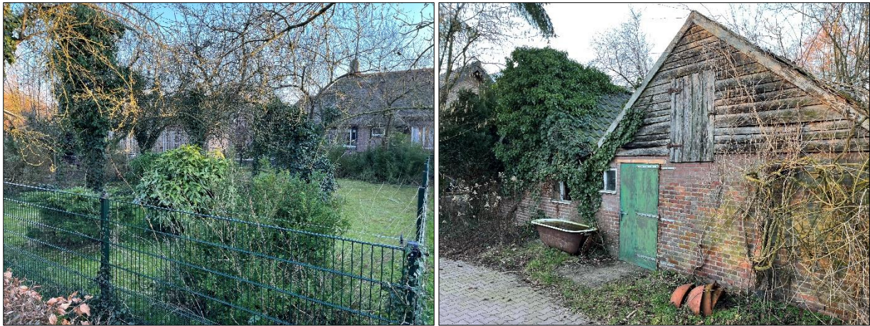
Potentiële nestlocaties van vogels in beplanting en het schuurtje.

Het plangebied behoort tot functioneel leefgebied van verschillende vogelsoorten. Vogels benutten het plangebied als foerageergebied en vermoedelijk nestelen er jaarlijks vogels in het plangebied. Vogels kunnen een nestlocatie bezetten in beplanting en in het te slopen schuurtje. Vogelsoorten die mogelijk in het plangebied nestelen zijn merel, zanglijster, heggenmus, winterkoning, vink, roodborst en tjiftjaf. Er zijn tijdens het bezoek geen huismussen in het plangebied aangetroffen en er zijn geen geschikte nestlocaties voor deze soort aanwezig in het plangebied. Het met dakpannen gedekte schuurtje beschikt niet over dakbeschot. Er zijn geen oude of potentiële nesten van roofvogels of uilen in of rondom het plangebied waargenomen. Het plangebied valt binnen het verspreidingsgebied van de steenuil, kerkuil en ransuil maar er zijn geen aanwijzingen aangetroffen dat deze soorten in het plangebied voorkomen (NDFP, 2023).