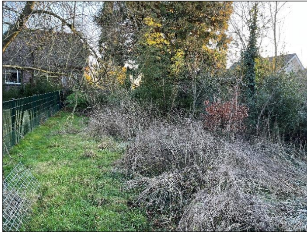
Amfibieën kunnen een (winter)rustplaats bezetten in holen en gaten in de grond.

Tijdens het veldbezoek zijn geen amfibieën waargenomen, maar gelet op de inrichting en het gevoerde beheer, wordt het plangebied als functioneel leefgebied voor sommige algemene en weinig kritische amfibieënsoorten beschouwd. Amfibieën als bruine kikker, kleine watersalamander en gewone pad benutten het plangebied als foerageergebied en mogelijk bezetten ze er een (winter)rustplaats. Deze soorten kunnen een rust- en voortplantingsplaats bezetten in holen en gaten in de grond. Het te slopen schuurtje is niet toegankelijk voor amfibieën. Het plangebied wordt niet als functioneel leefgebied van zeldzame amfibieënsoorten als kamsalamander, rugstreeppad of poelkikker beschouwd (NDFF, 2023). Geschikt voortplantingsbiotoop ontbreekt in het plangebied.