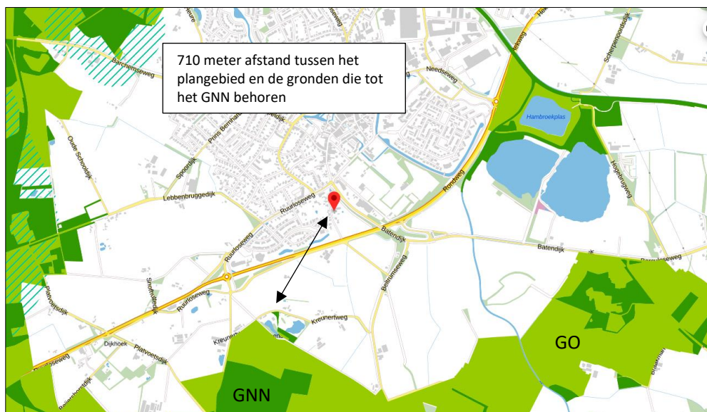
Ligging van Gelders Natuurnetwerk (GNN) in de omgeving van het plangebied. De ligging van het plangebied wordt met de rode marker aangeduid. Gronden die tot de Groene Ontwikkelingszone (GO) behoren, worden met de lichtgroene kleur aangeduid.

Het plangebied ligt op minimaal 710 meter van gronden die tot het Gelders Natuurnetwerk behoren. Op onderstaande afbeelding wordt de ligging van het Gelders Natuurnetwerk en de Groene Ontwikkelingszone in de omgeving van het plangebied weergegeven.