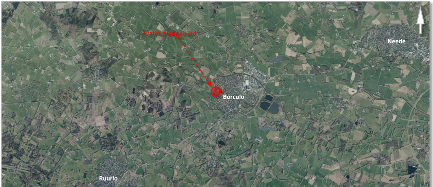
Kaart 3: Locatie plangebied aan de Heure / Barchemseweg te Borculo in het streekgebied

Het plangebied ligt in het westen van Borculo, met bebouwing (in het noorden en zuiden). Ten oosten van de planlocatie ligt een waterzuivering. In het westen ligt akkerland.