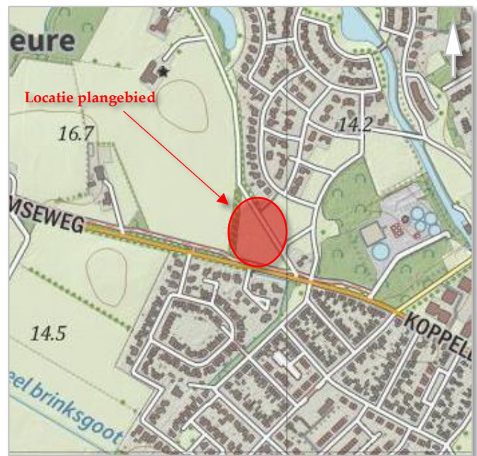
Kaart 5: Ligging en opbouw plangebied aan de Heure / Barchemseweg te Borculo