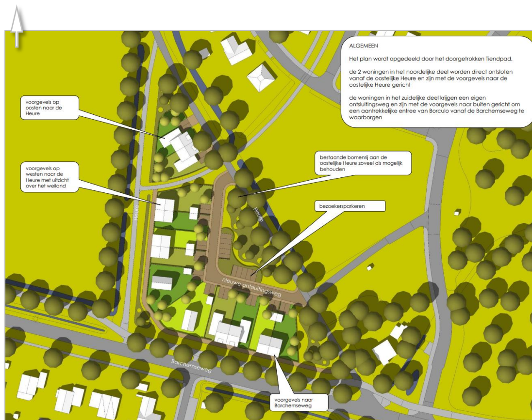
Kaart 1: Impressie Plangebied Heure / Barchemseweg te Borculo omgrenzing plangebied

Om aantoonbaar te maken of in plangebied beschermde flora- en fauna aanwezig is of mogelijk aanwezig kan zijn, is een quickscan noodzakelijk. Met deze quickscan wordt tevens een advies gegeven ten aanzien van ecologisch waardevolle componenten in het plangebied en mogelijkheden om deze te consolideren en te versterken.