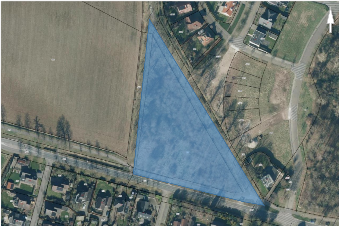
Kaart 2: Kadastrale kaart plangebied (blauw gearceerd). Kadastrale percelen: BCL00-F-737, BCL00-F-737, BCL00-F-739

De quickscan kan tevens aanleiding zijn voor aanvullend onderzoek naar (functioneel gebruik van) soorten. Ook wordt nagegaan of er negatieve effecten op nabijgelegen beschermde gebieden zijn dan wel dat nadere toetsing in dit kader nodig is.