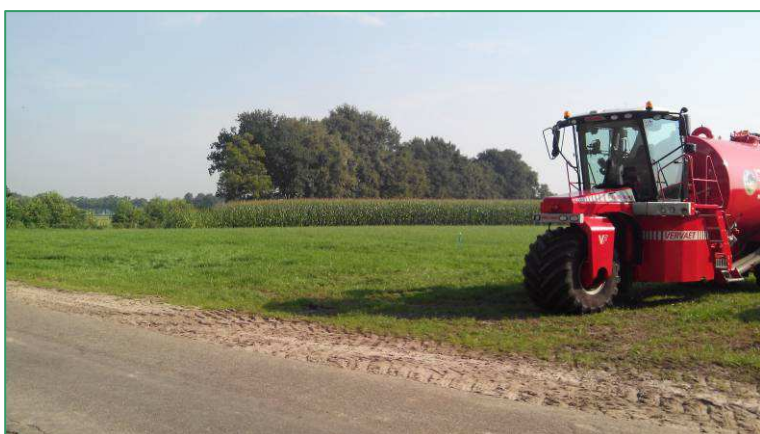
Zicht op de nieuwbouwlocatie.