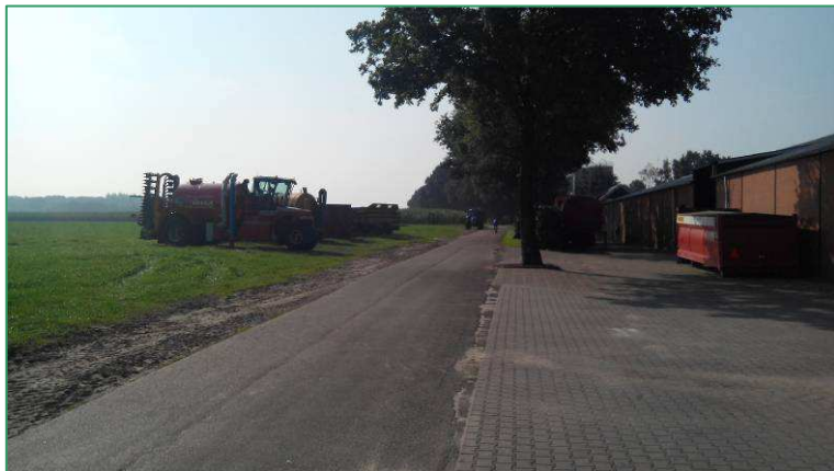
Zicht op de Eigdeweg richting het zuiden. De nieuwe loods is gepland aan de linkerkant van de weg. Rechts het huidige loonbedrijf Timmerje.