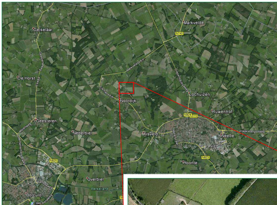
Figuur 1. Ligging onderzoeksgebied. Uitsnede: globale begrenzing onderzochte bouwblok.