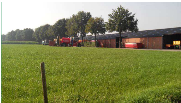
Op de voorgrond het graslandperceel waar de nieuwe loods is gepland. Op de achtergrond de huidige loodsen.