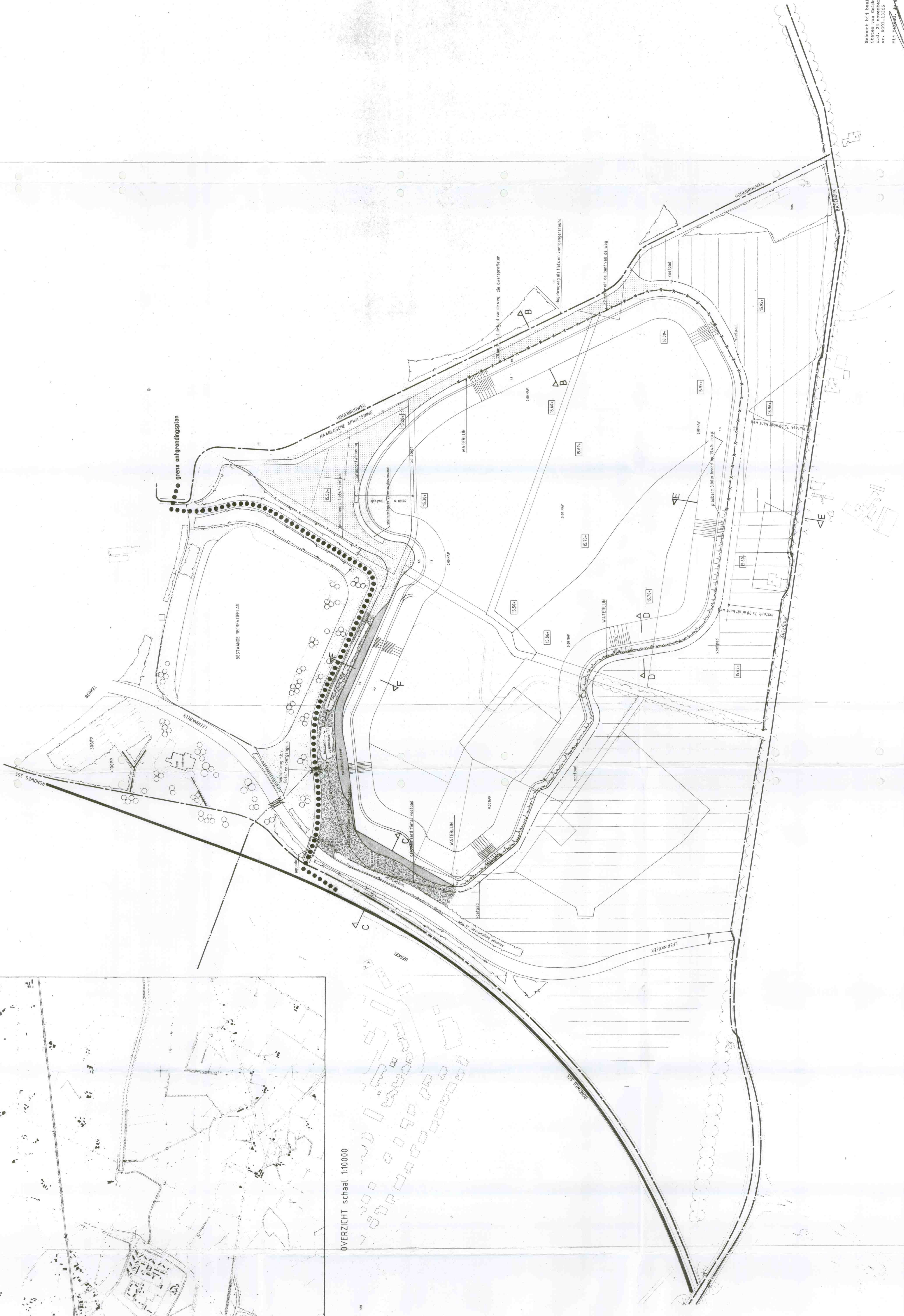
OVERZICHT schaal 1:10000