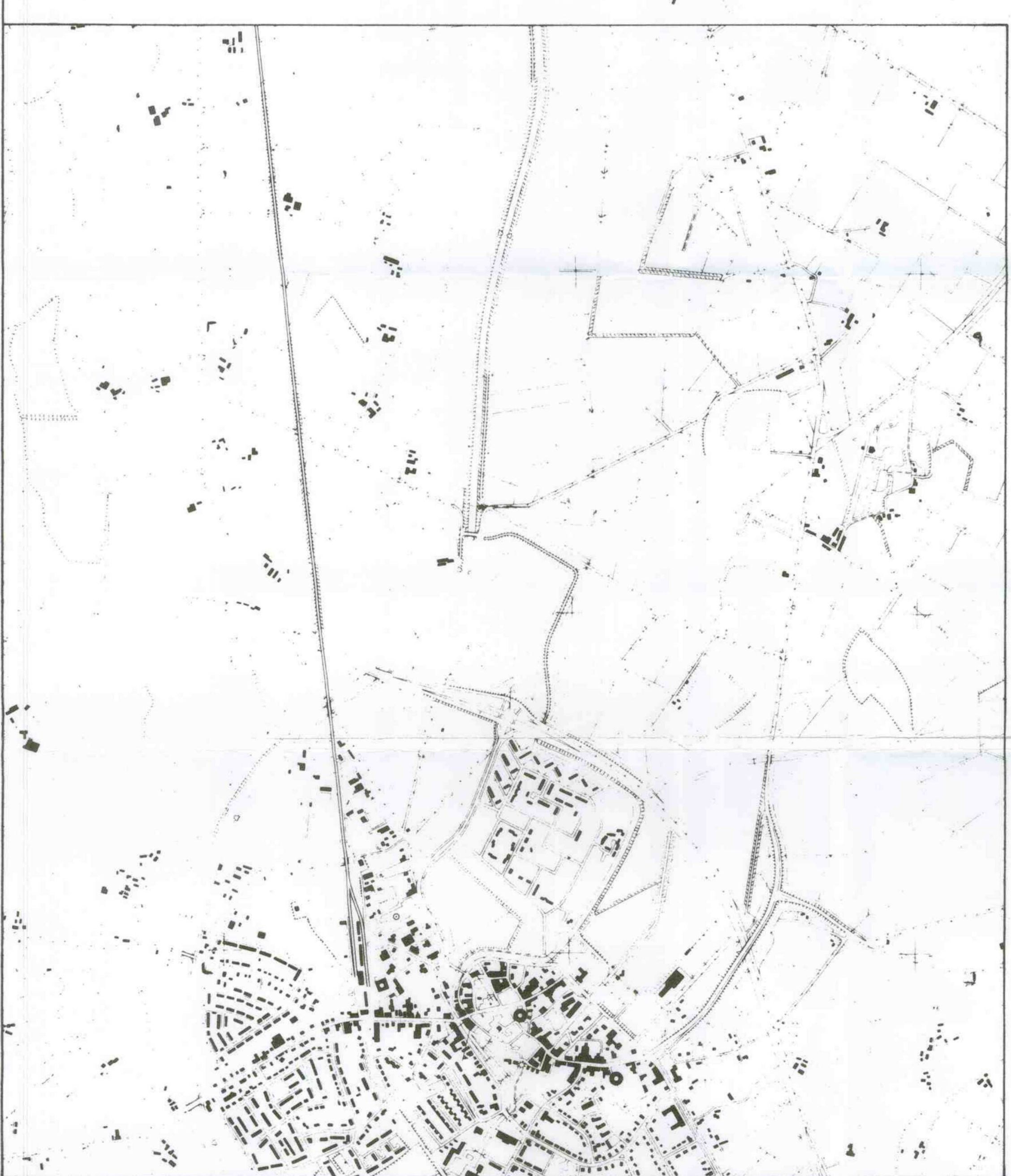
OVERZICHT schaal 1:10000