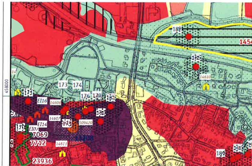
Eibergen, kaart 2