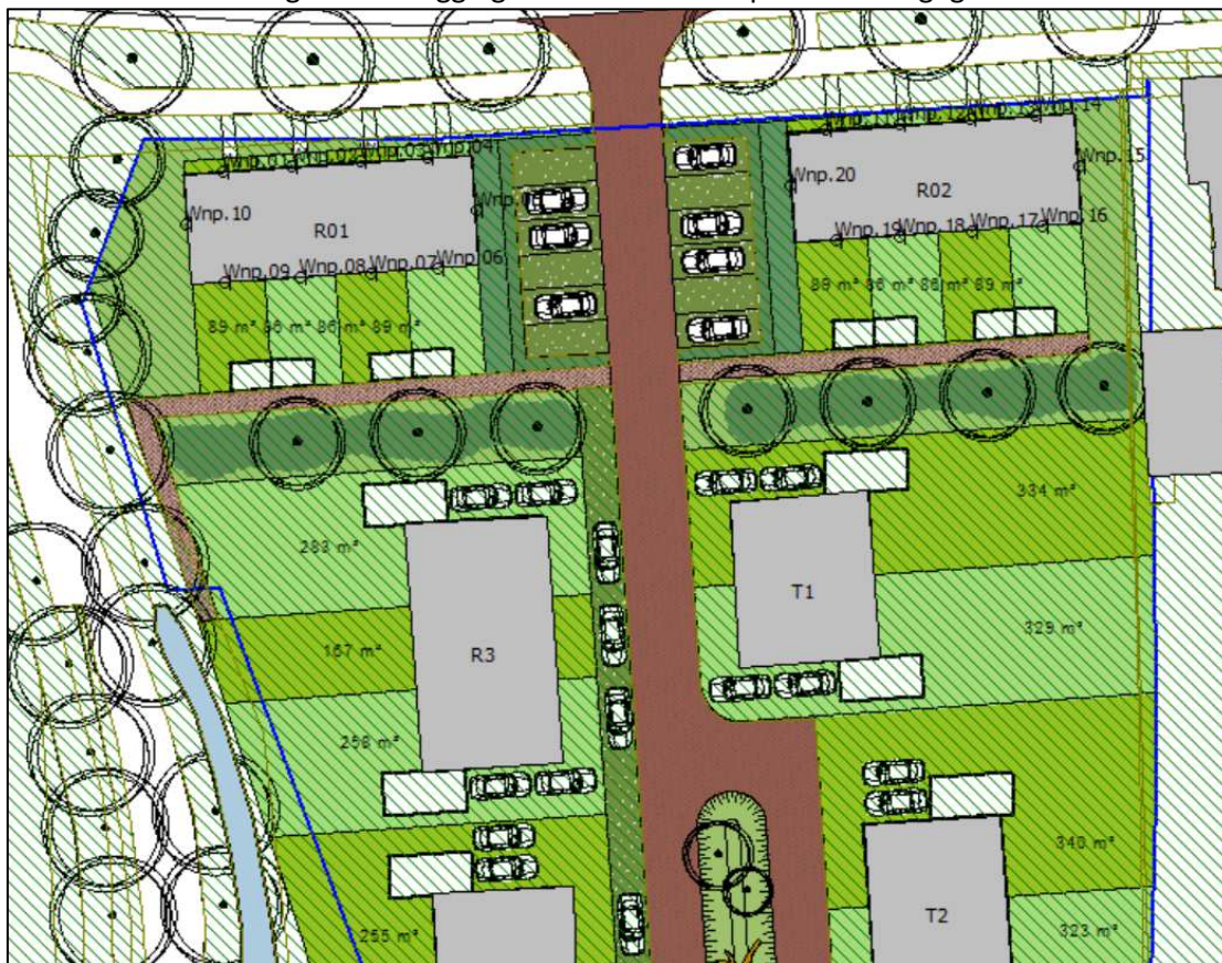
Ligging van de waarneempunten

In de onderstaande figuur is de ligging van de waarneempunten weergegeven.