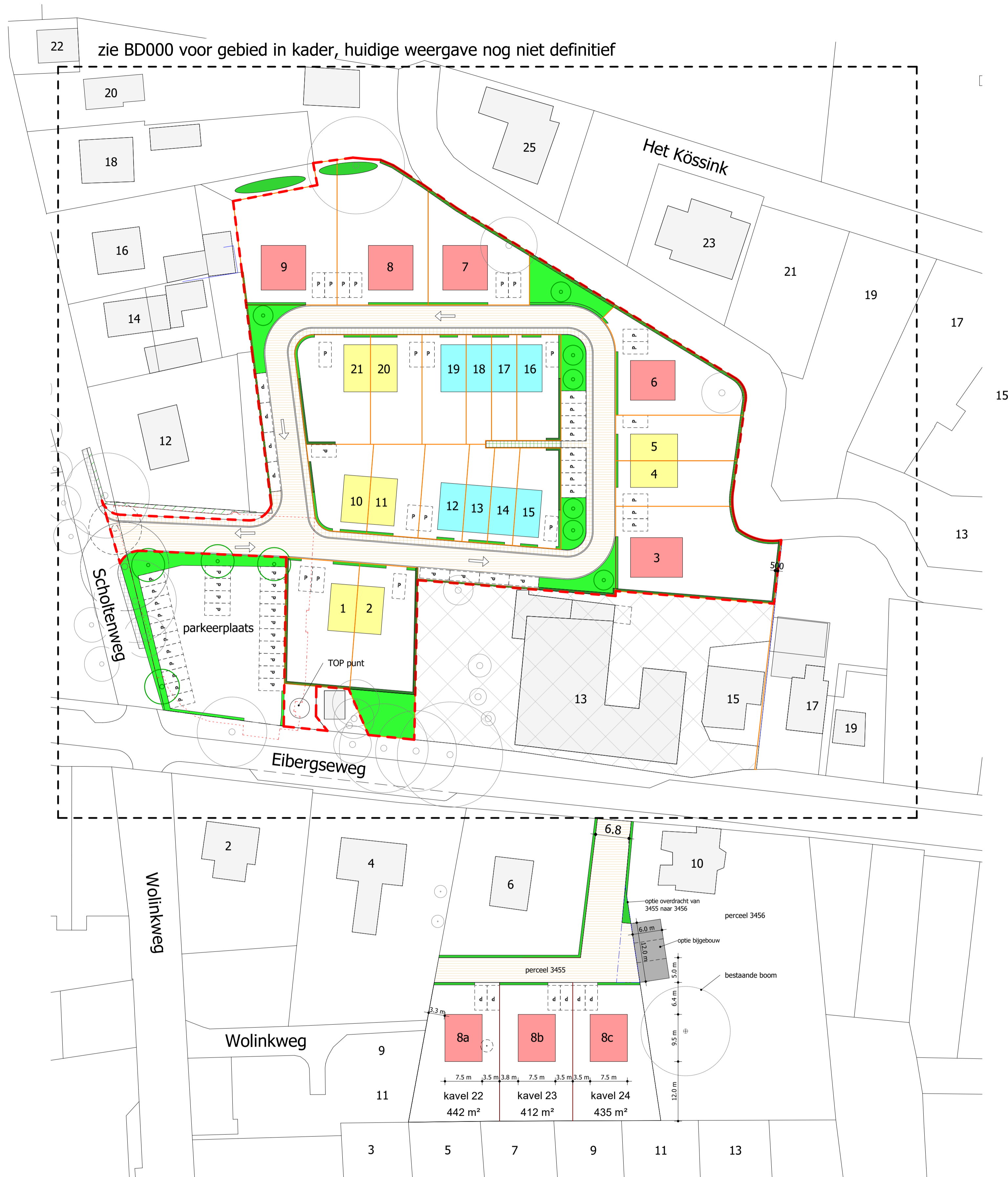
Situatie 1 : 500