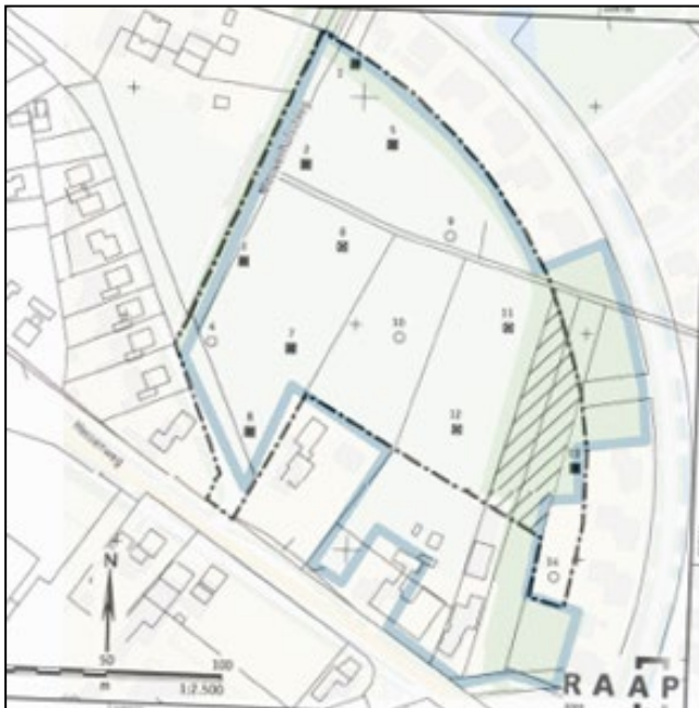
Afbeelding 3: Het huidige plangebied geprojecteerd onder de kaart van het archeologisch onderzoek uit 2005.