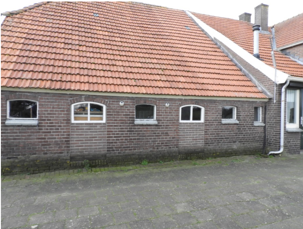
Foto overzicht Strikkersteeg 1 Ruurlo

Bouwkundig tekenaar/adviseur voor al uw bouw- verbouwwerkzaamheden