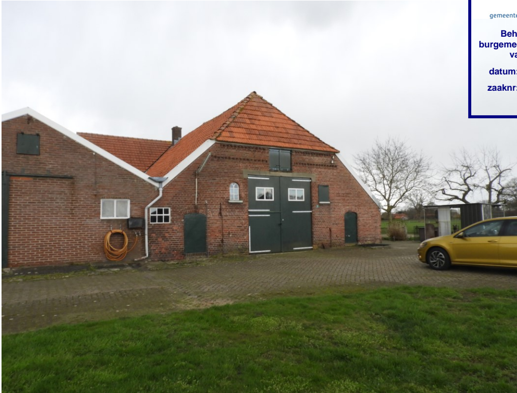
Foto overzicht Strikkersteeg 1 Ruurlo

Bouwkundig tekenaar/adviseur voor al uw bouw- verbouwwerkzaamheden