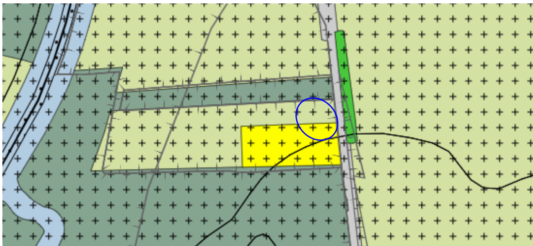
Uitsnede plankaart bestemmingsplan Buitengebied Berkelland 2020

Het perceel Galgenveldsdijk 1 heeft volgens het bestemmingsplan 'Buitengebied Berkelland 2020' de bestemming 'Wonen' en het aangrenzende perceel waarop het bijgebouw wordt gerealiseerd heeft de bestemming "agrarisch met waarden - landschapswaarden". De ingediende aanvraag past qua toegestane totale oppervlakte aan bijgebouwen en het bouwen van een nieuw gebouw ten behoeve van een B&B niet in het bestemmingsplan.