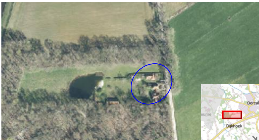
Locatie bestaande bebouwing Galgenvelddijk 1 (blauwe cirkel)

Het perceel Galgenvelddijk 1 ligt in het buitengebied iets ten zuidwesten van de kern Borculo. De locatie is te bereiken via de Lebbenbruggedijk of Barchemseweg en ligt aan een zandweg. Het perceel grenst aan de zuidzijde en westzijde aan een bosgebied en aan de noord- en oostzijde aan agrarisch gebied. In de directe omgeving van het perceel zijn weinig bebouwde percelen.