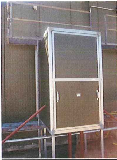
Foto: geluidwerende kast om bestaande mixer

Alle andere roerwerken van de inrichting zitten onder het mestniveau. Eén van de voorschriften in de omgevingsvergunning milieu van 16 juni 2011 luidt dat binnen 6 maanden na realisering van de drie vergisters (uitbreiding) een akoestisch onderzoek moet worden uitgevoerd. Bij dat onderzoek moeten de akoestische voorschriften opnieuw worden getoetst. In dat onderzoek wordt dit roerwerk meegenomen. Als uit dat onderzoek blijkt dat niet wordt voldaan aan de gestelde normen moeten aanvullende maatregelen worden genomen.