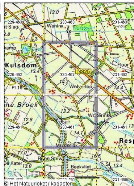
Figuur 2: Kaart en rapport Natuurloket (locatie aangegeven met pijl)

Landelijke vegetatiedatabank: gezamenlijke kilometerhokken