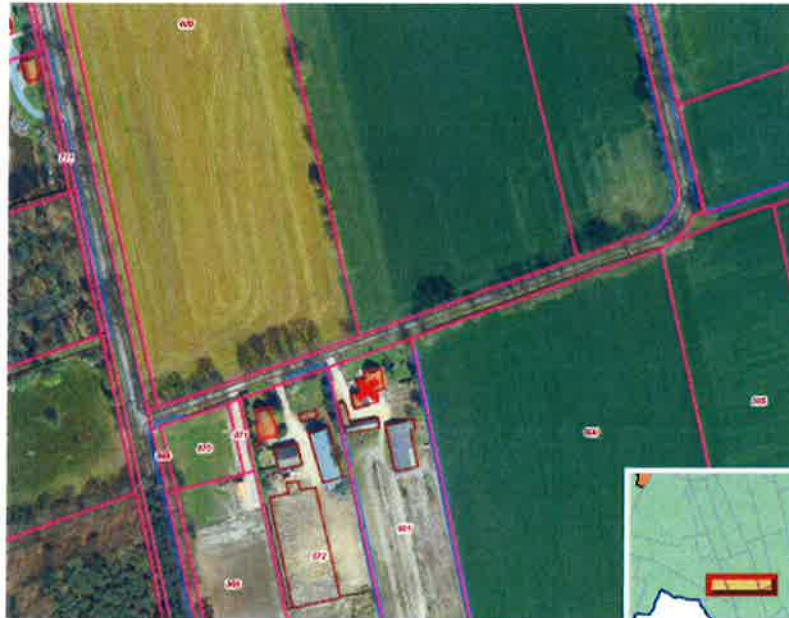
Luchtfoto (maart 2015)

Bij de gemeente Berkelland is het verzoek binnengekomen om het bestemmingsplan te wijzigen voor het perceel Noachweg 7 in Eibergen. Verzocht wordt om de agrarische bestemming te wijzigen in een woonbestemming.