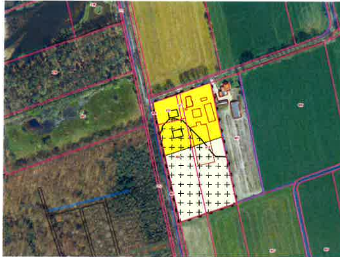
Verbeelding van de bestemming "Wonen" op het naastgelegen perceel (niet op schaal)

Noachweg 9 in de afgelopen jaren al omgezet in een woonbestemming. Dit is gebeurd door vaststelling van het bestemmingsplan "Buitengebied, Noachweg 9 Eibergen 2011" op 28 juni 2011. De verbeelding van dit digitale bestemmingsplan is hieronder weergegeven op de ondergrond van de luchtfoto: