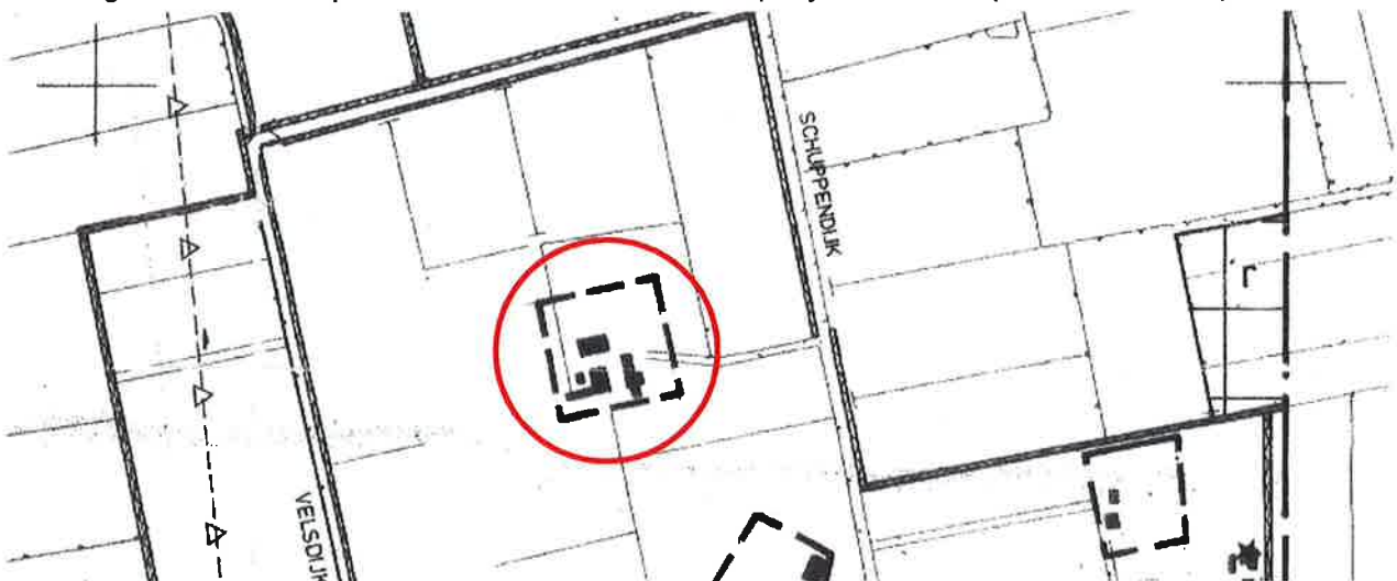
Afbeelding 2: plankaart bestemmingsplan "Buitengebied, integrale herziening" (Borculo).

Sinds de vernietiging van het bestemmingsplan "Buitengebied Berkelland 2012" op 27 augustus 2014 (ABRvS, nr. 201308008/1/R2), is voor het perceel Horstweg 6 het bestemmingsplan "Buitengebied, integrale herziening" weer van toepassing. De raad van de voormalige gemeente Borculo stelde dit bestemmingsplan vast op 24 juni 1993, waarna Gedeputeerde Staten van Gelderland het gedeeltelijk goedkeurden op 16 februari 1994. Het goedkeuringsbesluit werd onherroepelijk door de uitspraak van de Afdeling bestuursrechtspraak van de Raad van State op 7 januari 1997 (nr. E01.94.0086).