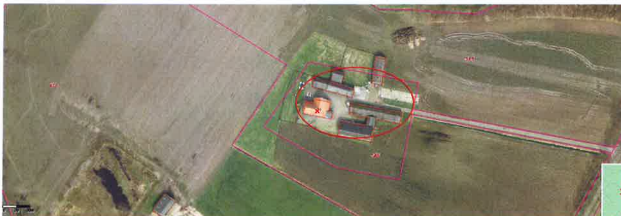
Afbeelding 1: Luchtfoto

Bij de gemeente Berkelland is op 2 februari 2018 het verzoek binnengekomen om het bestemmingsplan te wijzigen voor het perceel Bruggertweg 1a in Beltrum. Verzocht wordt om de agrarische bestemming te wijzigen in een woonbestemming.