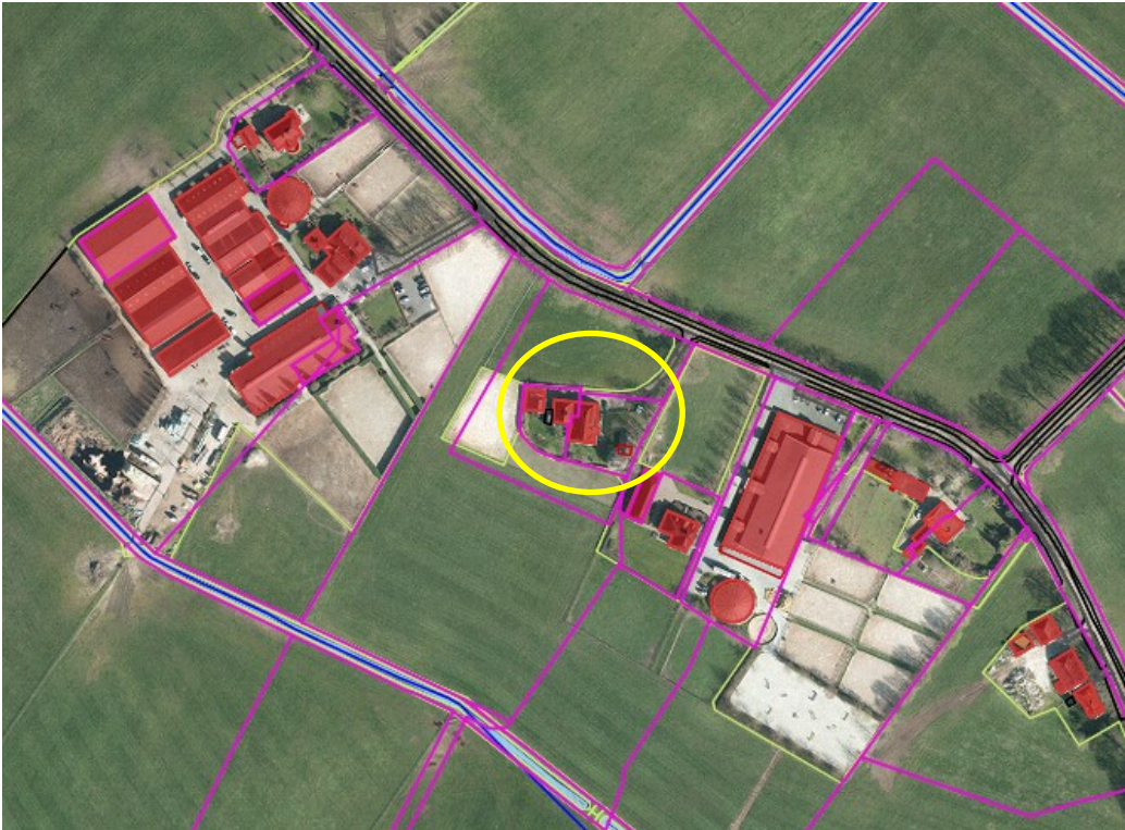
Afbeelding 1: Ligging perceel Kulsdom 7-7a Geesteren (luchtfoto 2021).

Bij de gemeente Berkelland is op 17 januari 2022 het verzoek binnengekomen om het bestemmingsplan voor het perceel Kulsdom 7-7a in Geesteren (kadastraal bekend gemeente Geesteren, sectie K, nummers 1123 en 1532) te wijzigen. Verzocht wordt om de geldende agrarische bestemming om te zetten in een woonbestemming.